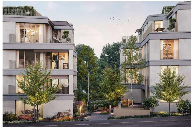
Frohaldstrasse 21 + 27, 8038 Zürich