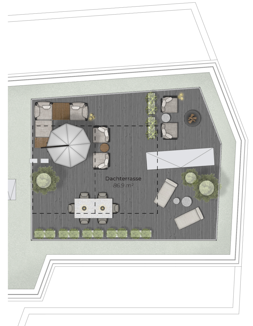
Dachterrasse, Roof terrace