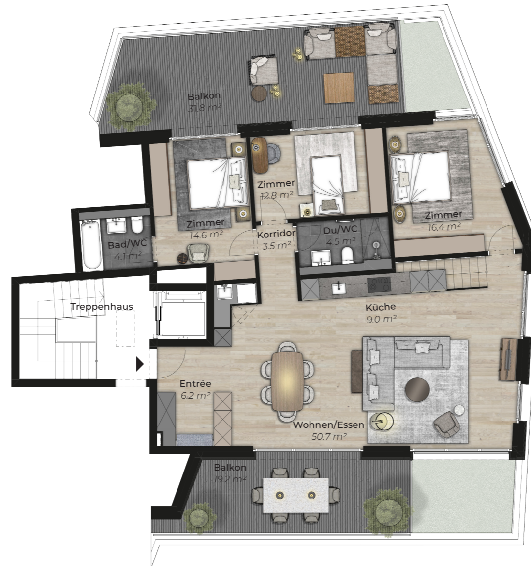
Attikageschoss, Top floor