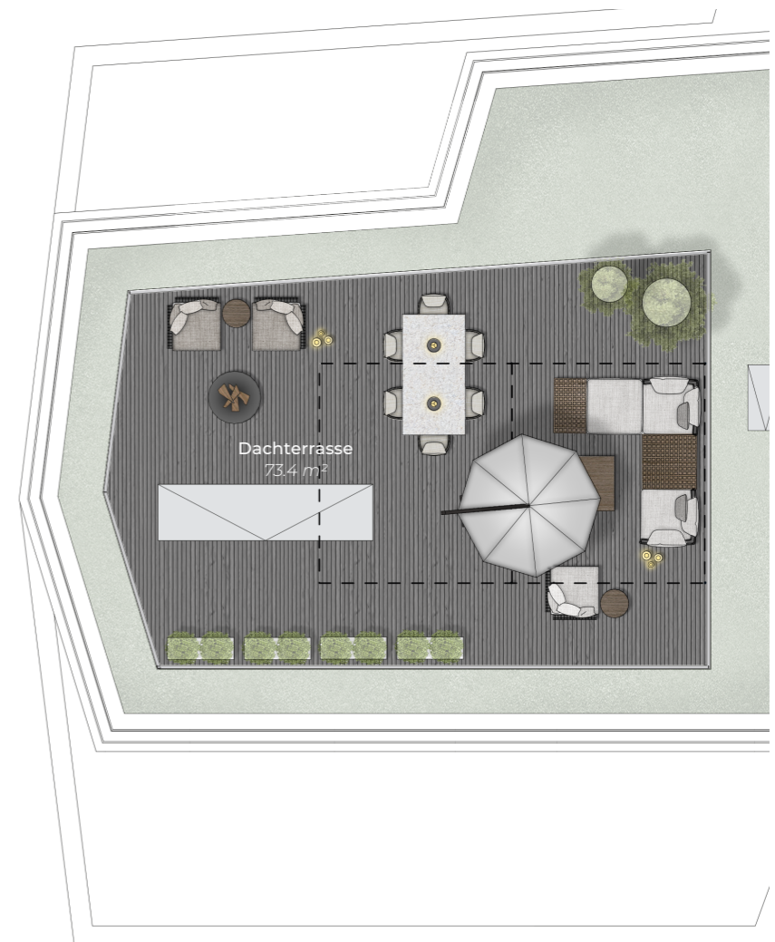
Dachterrasse, Roof terrace