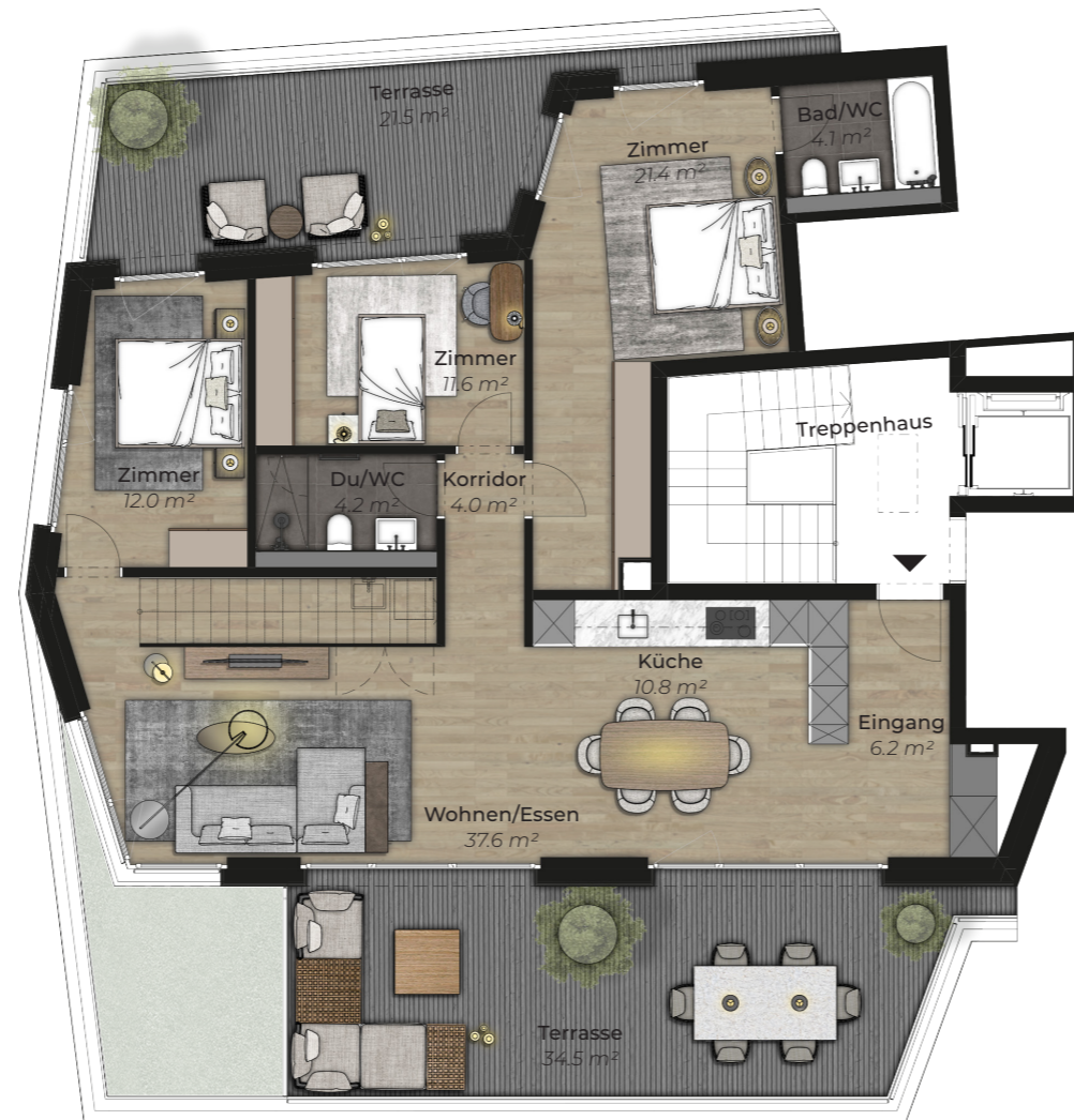
Attikageschoss, Top floor