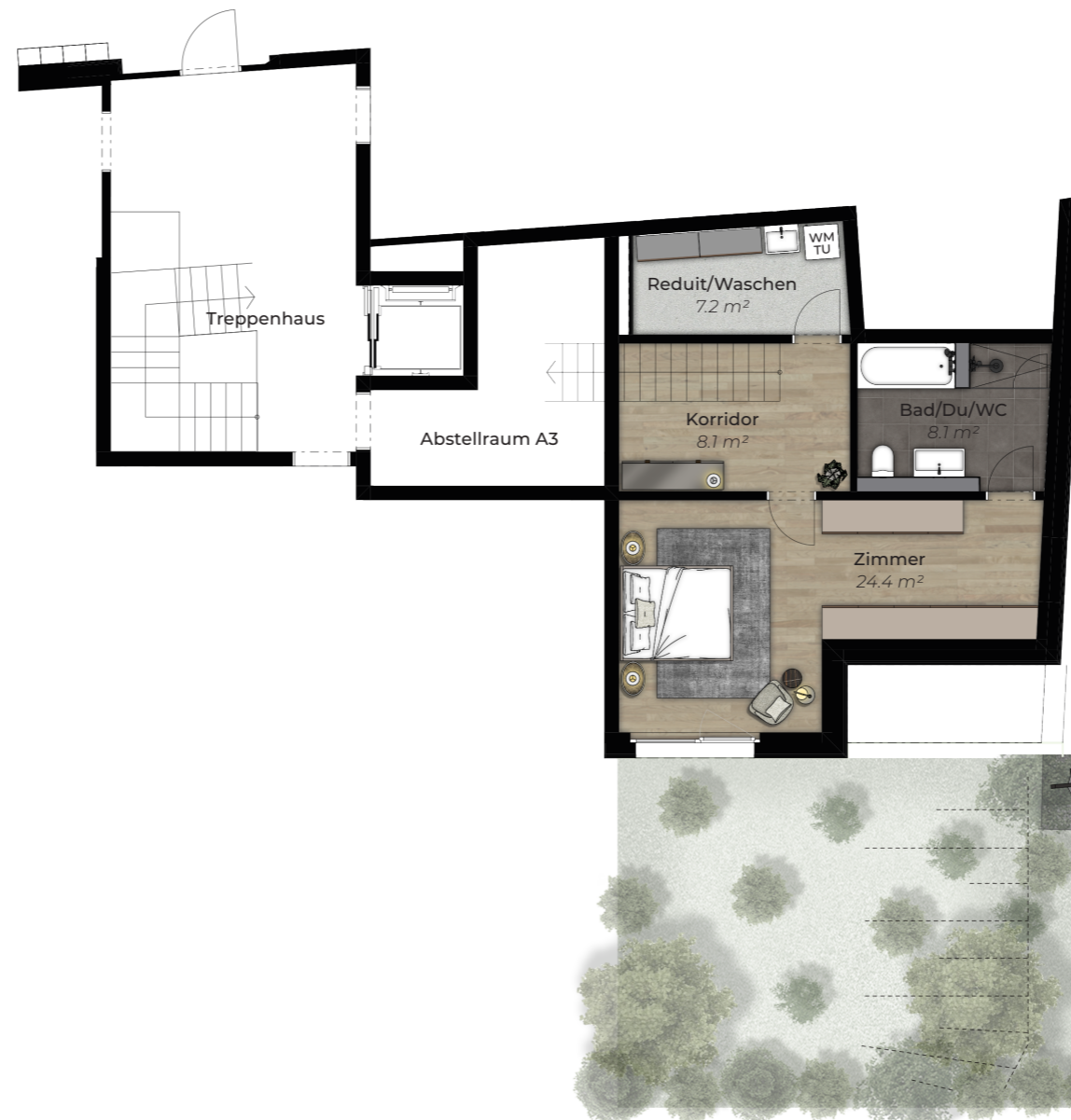
Erdgeschoss, Ground floor