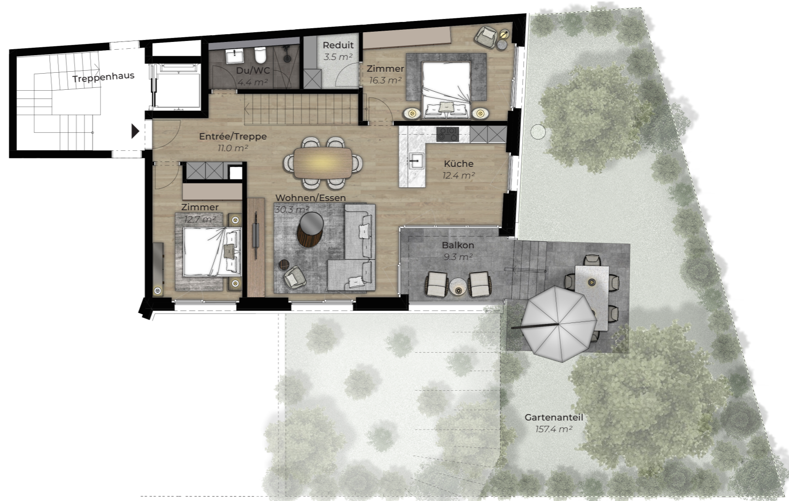
1. Obergeschoss, First floor